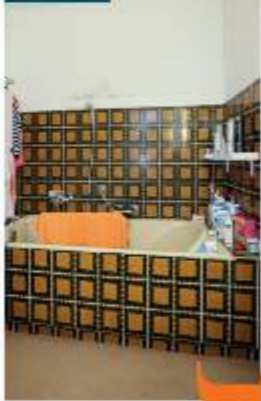
vorher: Badewanne mit hohem Einstieg