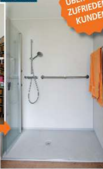
nachher: Barrierefreie, rutschfeste Dusche mit wegfaltbarer Trennwand