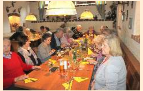
Im März, Bad Vöslau (Führung Mineralwasser AG) April, Marillenblüte Wachau u. Langthalerhof