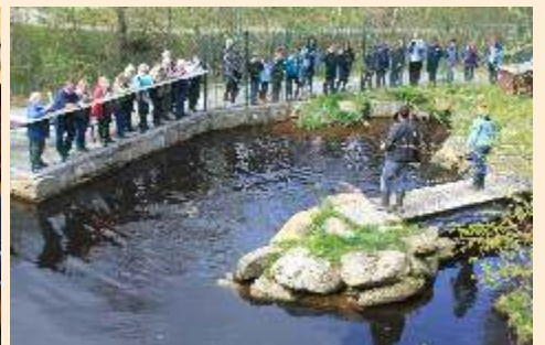
Mai, Besuch der Brauerei Schrems (Führung), Mittagessen in der Waldschenke und UnterWasserReich und im Juni Mariazell mit Bürgeralpe und Hubertuskeller Bad Vöslau.