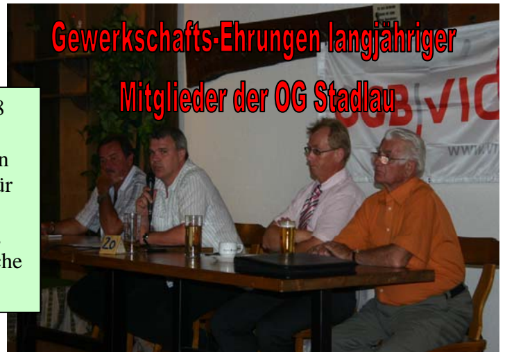
Gewerkschafts-Ehrungen langjähriger Mitglieder der OG Stadlau

Bei der am 16. Mai 2008 abgehaltenen Mitgliederversammlung der Aktiven OG 17 Stadlau wurden für ihre langjährige Gewerkschaftszugehörigkeit (40, 50 und 60 Jahre) zahlreiche KollegInnen geehrt.