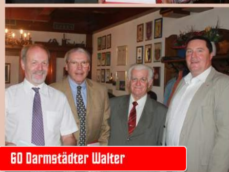
60 Darmstädter Walter