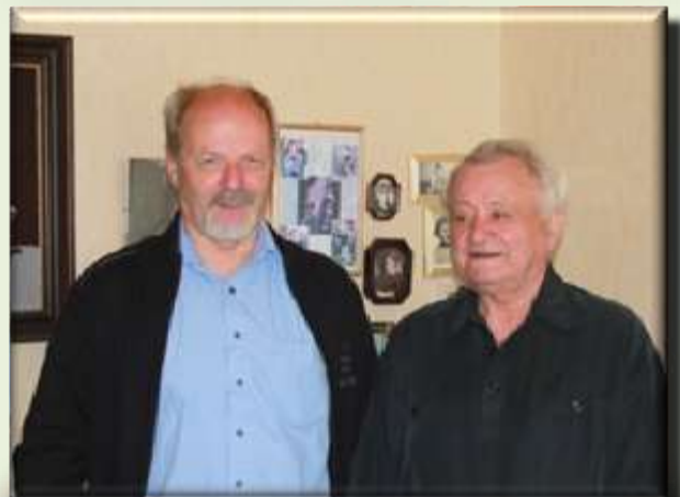
Tauber Richard 80.Geb.