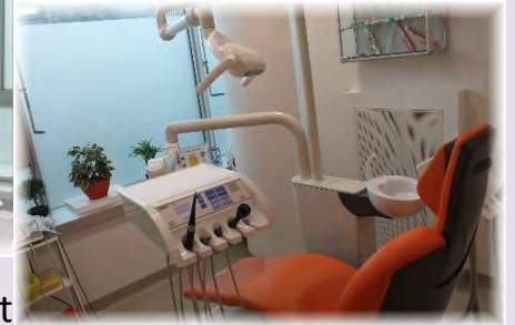
Zahnbehandlung, Mundhygiene und Zahntechniker alles vor Ort